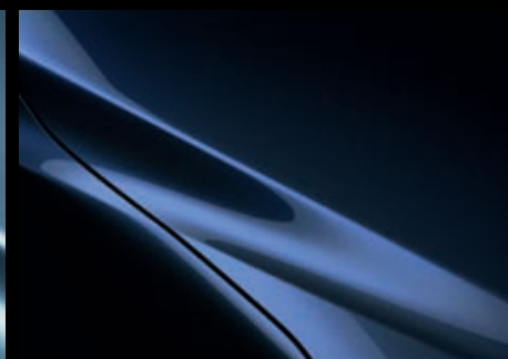
Deep Crystal Blue MC