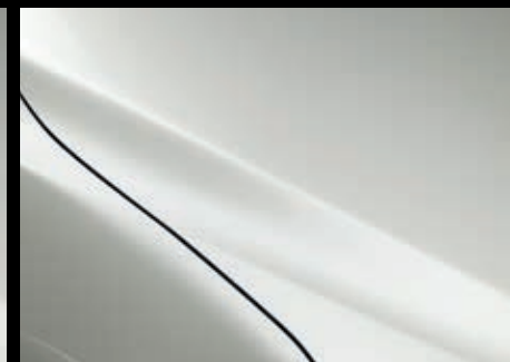
Snowflake White Pearl