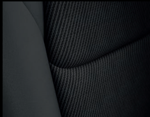
КОМПЛЕКТАЦИЯ DRIVE – ЧЕРНАЯ ТКАНЬ