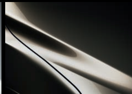
Titanium Flash Mica