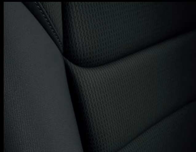
КОМПЛЕКТАЦИЯ АКТИВ – ЧЕРНАЯ ТКАНЬ