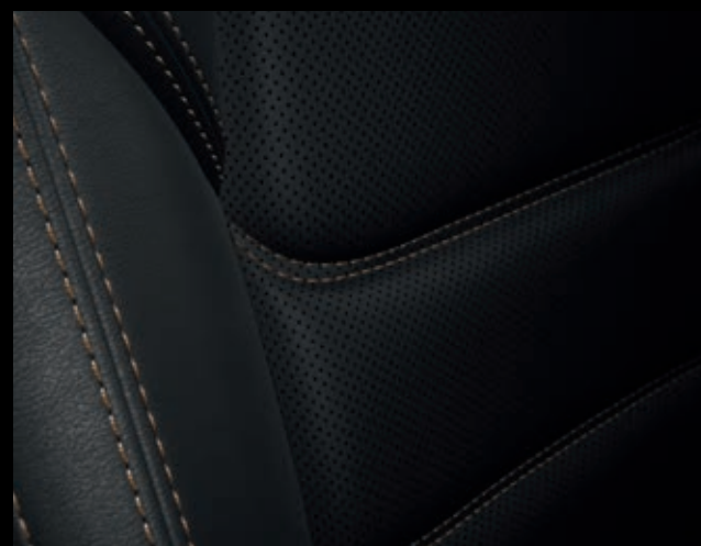
КОМПЛЕКТАЦИЯ SUPREME – ЧЕРНАЯ КОЖА