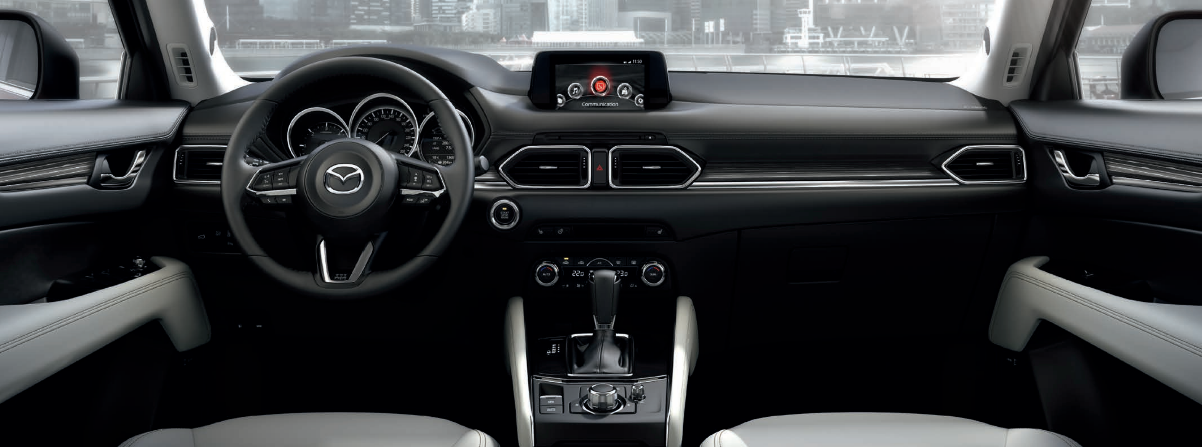
MAZDA CX-5 В КОМПЛЕКТАЦИИ SUPREME, ОТДЕЛКА САЛОНА БЕЛОЙ КОЖЕЙ