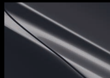
Meteor Gray MC