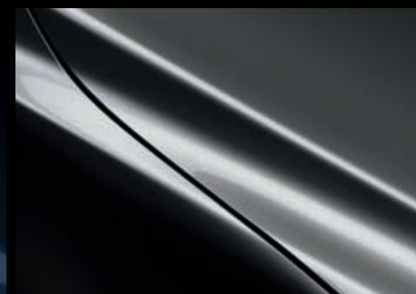
Machine Gray Metallic