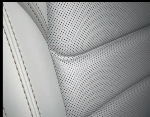
КОМПЛЕКТАЦИЯ SUPREME – БЕЛАЯ КОЖА