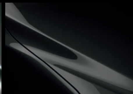
Jet Black Mica